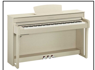
ピアノレッスンに、 まだ許せる「クラビノーバ」

本題に戻ってこの楽器の正体ですが、①鍵盤の位置を覚えられないのは「卓上キーボード」ですね。練習のたびにテーブルに置くので『おへそのド』が定まらないからでしょう。②オクターブ変わったとき鍵盤を間違ってもキーボードですね。全部ではありませんが、ピアノの鍵盤より1mm幅が狭いものが多いです。この種の楽器は、鍵盤の沈み方も浅い、ピアノは10mm沈みますが、そこまでは沈みません。自ずとタッチも浅くなります。