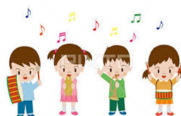
【楽しいアンサンブル、聴いていてワクワクするアンサンブル、奏者はどきどきアンサンブル、レッツ・チャレンジ】