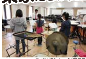
JEUGIA選抜キッズ練習風景